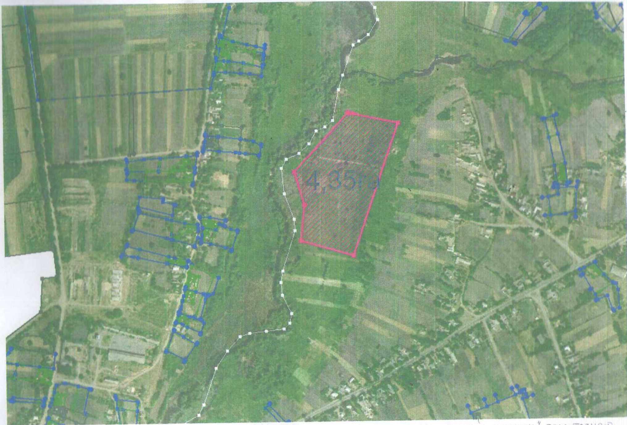
Схема ботаничної пам'ятки природи місцевого значення „Бродецький рябчик” орієнтовною площею 4,35 га